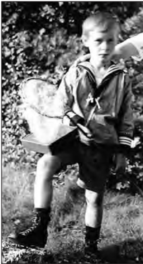
Abb. 1: Gustaf de Lattin 1920.