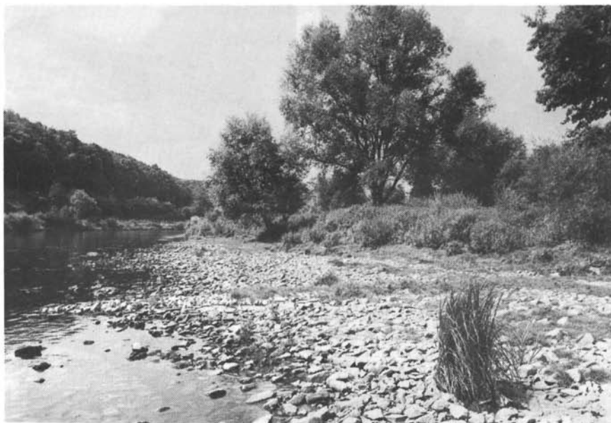
Abb. 2: Flußuferläufer ( Tringa hypoleucos ) – Brutbiotop auf der ehemaligen Saarinsel bei Hamm (b. Taben) vor der Saarkanalisation. Juli 1977