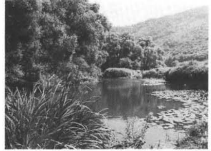
Abb. 3 und 4:

Reizvolles Altwasser an der ehemaligen Saarinsel bei Hamm (b. Taben) vor der Saarkanalisation. Auf der Wasserfläche sind Weiße Seerosen ( Nymphaea alba ), Gelbe Teichrosen ( Nuphar luteum ) und Pfeilkraut ( Sagittaria sagittifolia ) zu erkennen.